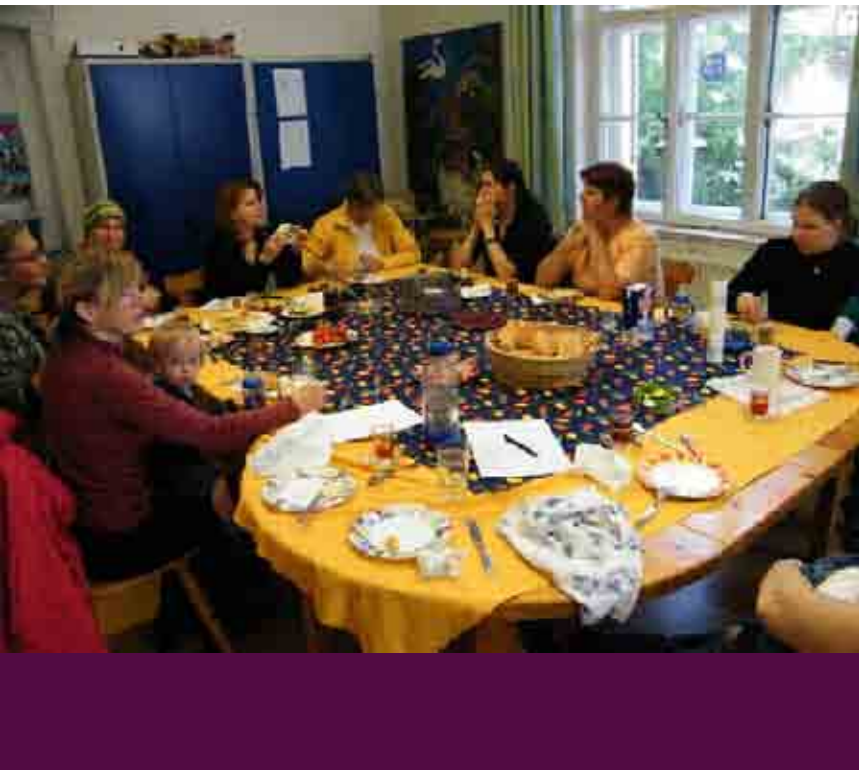
Abb. 2: Intensive Gespräche beim Orientalischen Frühstück

Die Gespräche wurden immer intensiver und vertrauensvoller. Durch die Kinder kamen alle Frauen in guten Kontakt und konnten auch Fragen stellen, die sie in „normaler Umgebung“ nicht gestellt hätten.