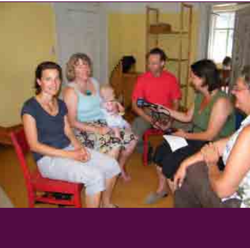
Abb. 1: Beim Interview mit Bayern 1

Von den Altersgruppen interessierten sich werdende Mütter, Mütter mit Babys, Eltern mit Kindergartenkindern, Grundschüler, pädagogische Fachkräfte (Schulen, Erzieherinnen, Jugendamtsmitarbeiter) Eltern und Senioren für unser Projekt.