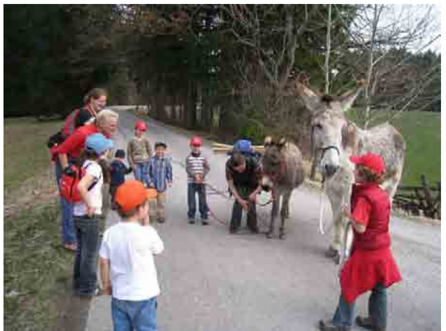
Abb. 3: Will der Esel weiter?

Die Kinder waren durch die Anwesenheit der Esel hoch motiviert und die Gruppe konnte eine weitere Strecke zurücklegen als ohne Esel. Zumal auch die Möglichkeit bestand, sich vom Esel ein Stück weit tragen zu lassen. Nebenbei erfuhren die Teilnehmer auch Interessantes über andere einheimische Lebewesen und die Natur. Als krönenden Abschluss versuchten die Kinder den Eseln am Übungsplatz kleine „Zirkuskunststücke“ beizubringen.