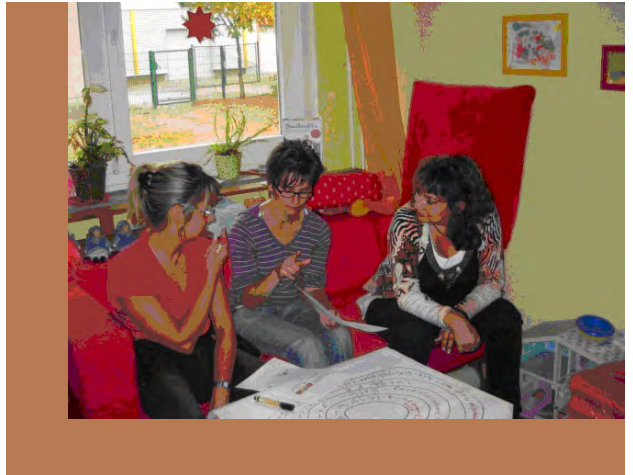
Lernwerkstatt im Rahmen des Aufbaukurses für Managerinnen in der Eltern-Kind-Zentren 07.09.2009 im Land Brandenburg (Rheinsberg)