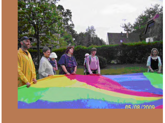
Lernwerkstatt im landkreisweiten Projekt „Familienarbeit im Verbund“ – FiV im Zentrum für Familienbildung, Familienerholung und Touristik Grieben 05.-06.08.2009