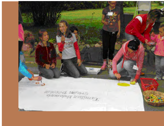
Workshop im Rahmen des deutsch-polnischen Kinderferienlagers im Zentrum für Familienbildung, Familienerholung und Touristik Grieben 25.-27.09.2010