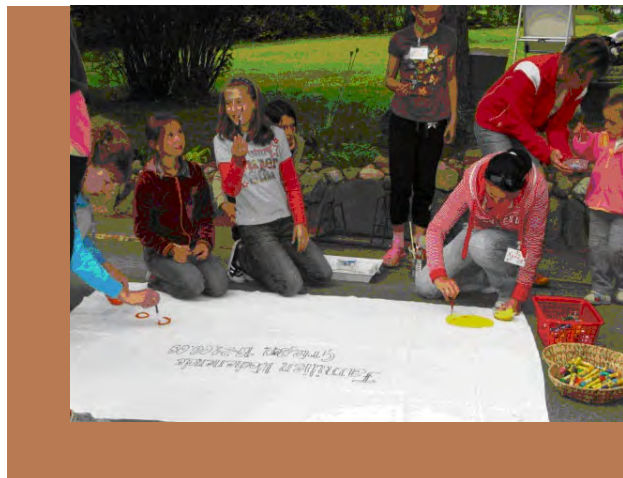
Kleiner Fachtag „Ach die Werte ...“ 21./22.12.2009