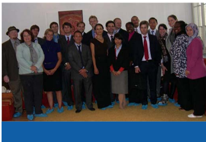
Stipendiaten aus den USA