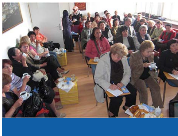
Multiplikatorinnen aus Rumänien