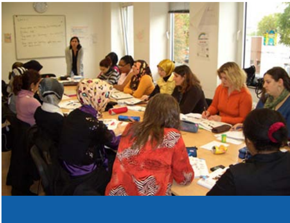
Integrationskurse für Mütter

Im Rahmen des Muslimischen Familienbildungswerks werden überwiegend Integrationskurse für Mütter, Erziehungskompetenzkurse für Eltern nach den Konzepten Starke Eltern - Starke Kinder und FuN (Familie und Nachbarschaft), Mutter-Kind-Kurse für jüngere Kinder und ihre Mütter, Erziehungsseminare für Väter sowie Fortbildungen für MultiplikatorInnen und MitarbeiterInnen aus dem sozialen, erzieherischen und Bildungsbereich angeboten.