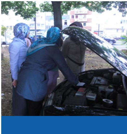
KFZ-Kurs für Frauen