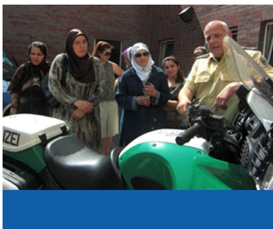
Teilnehmerinnen eines Integrationskurses zu Besuch bei der Polizei Köln-Ehrenfeld