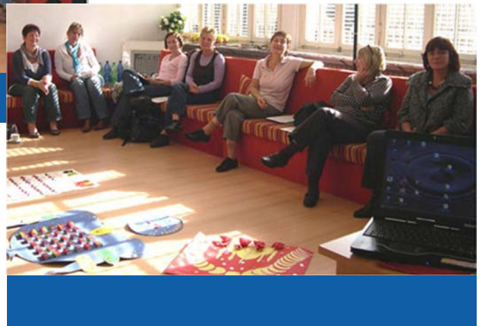
Fortbildungsgruppen von LehrerInnen und Erzieherinnen