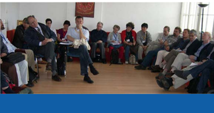
Journalisten aus Frankreich