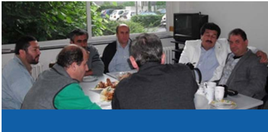
Erziehungsseminare für Väter