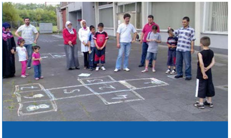
Erziehungskompetenzkurse für die ganze Familie