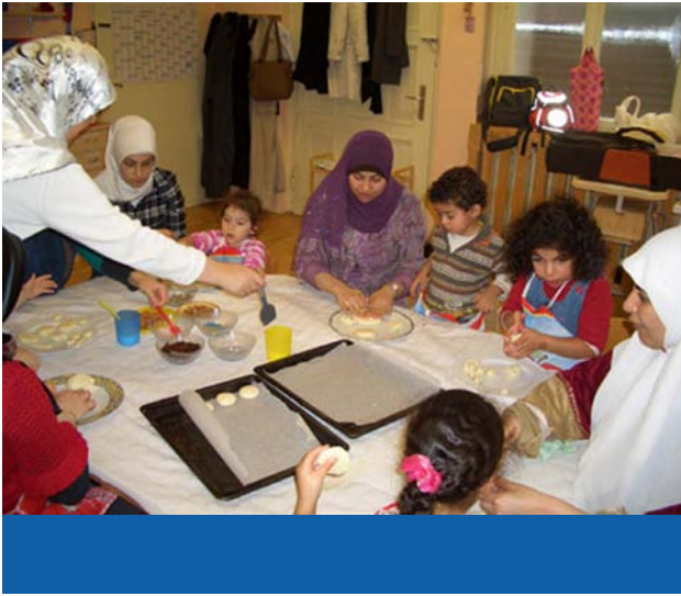
Erziehungsseminare für Mütter