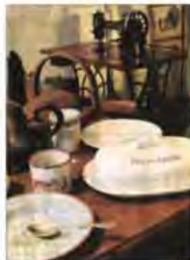
Eine kleine Ecke im Sanitäranstellungsraum zeigt eine bescheidene Küche von früher. Hier stehen auch eine Nähmaschine sowie ein kleiner Ofen, in dem die Glut nie ausgehen durfte. Dafür hatte die Frau zu sorgen.